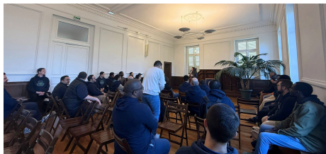
Les séminaristes du séminaire d'Orléans visitent le sanctuaire le 20 Mars

Fin Mars, c'est 40 séminaristes du séminaire d'Orléans qui sont venus à leur tour. Accompagnés d'une guide, ils ont parcouru le sanctuaire et redécouvert la vie de Bernadette Soubirous.