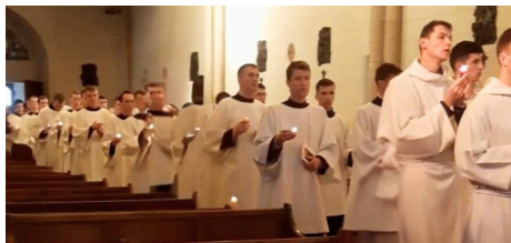
Les séminaristes St Martin en procession pour la messe du 02 Février

Ces dernières semaines, le sanctuaire Sainte Bernadette à Nevers a accueilli plusieurs groupes de séminaristes venus découvrir le lieu et se recueillir. Le 2 février, 95 séminaristes de la Communauté Saint-Martin ont participé à la messe, marquée par une belle procession.