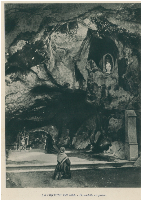
LA GROTTTE EN 1862. - Bernadette en prière.

Ainsi, Lourdes nous enseigne que Dieu agit dans la faiblesse, que la prière transforme les cœurs et que l'amour doit se tourner vers les plus fragiles.